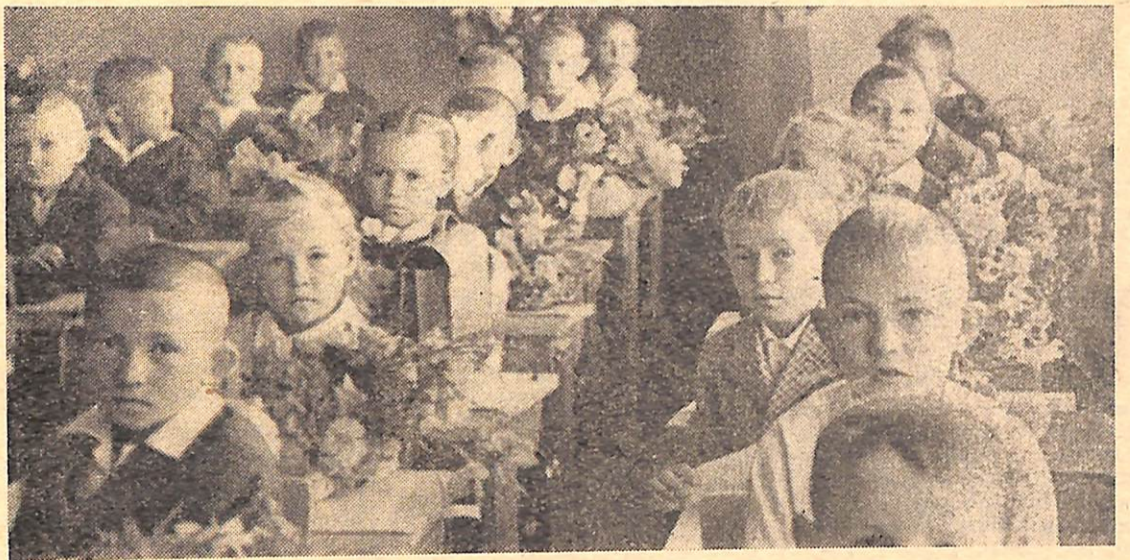
Мы сегодня на год старше стали...