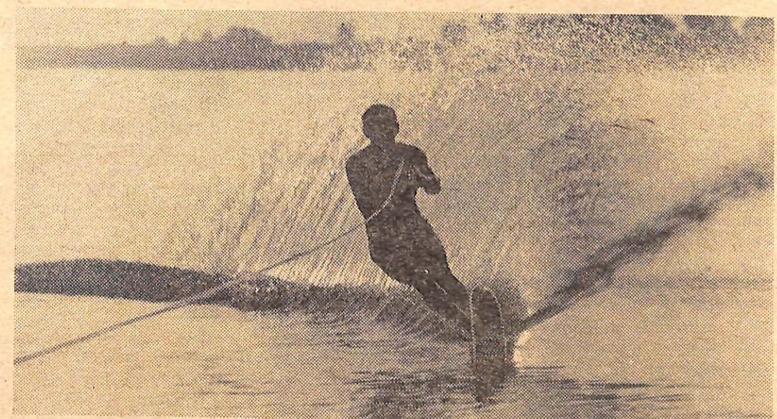
На грани двух стихий.